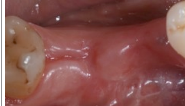
2 MESI POST-EX